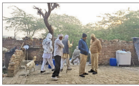
रोहतक। घटनास्थल पर लगी ग्रामीणों की भीड़।