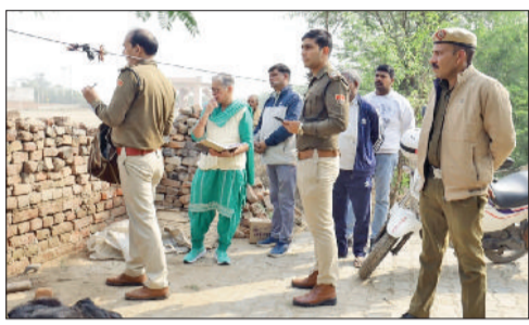
रोहतक। मौके पर जांच करती एफएसएल की टीम और पुलिस।