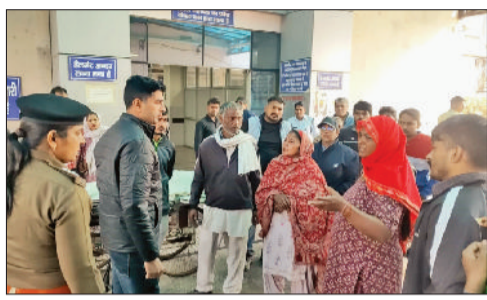
रोहतक। पीजीआई में पुलिस से बातचीत करते परिजन।