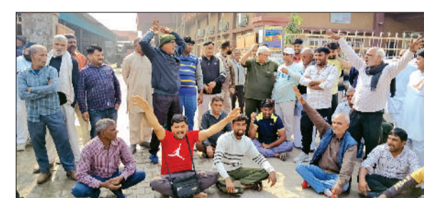
महम। नगर पालिका कार्यालय के गेट पर नारेबाजी करते रेहड़ी वाले।